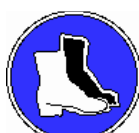
Chaussures de sécurité