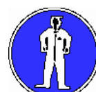
Vêtements de protection